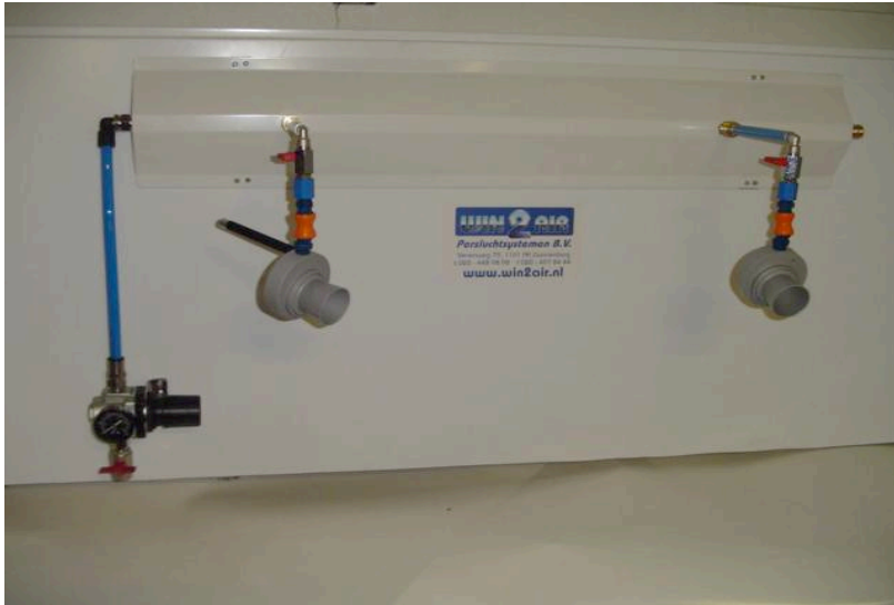
Basismodel Airwave Magnetisch paneel

Basisset bestaat uit 1 paneel met 2 venturi's 1 drukregelaar en 1 laserpointer en is eenvoudig uitbreidbaar door meerdere panelen aan elkaar te koppelen.